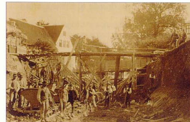
Fæstningskanalen under udgravning ved Lyngby Hovedgade 1887

Forsvarssagen og befæstningen af København blev hovedstridspunktet i dansk indenrigspolitik i 1880'erne og begyndelsen af 1890'erne. Perioden kaldes provisorietiden, fordi den konservative regering under konseilspræsident J. B. S. Estrup gennemtvang opførelsen af befæstningen med provisoriske (foreløbige) finanslove. Derimod protesterede oppositionspartiet Venstre, der navnlig repræsenterede landbefolkningen. I 1894 blev der indgået et forsvarsforlig, hvor Venstre accepterede den nu færdigbyggede befæstning mod et løfte om, at den ikke udbygges yderligere og nedlægges i 1922.