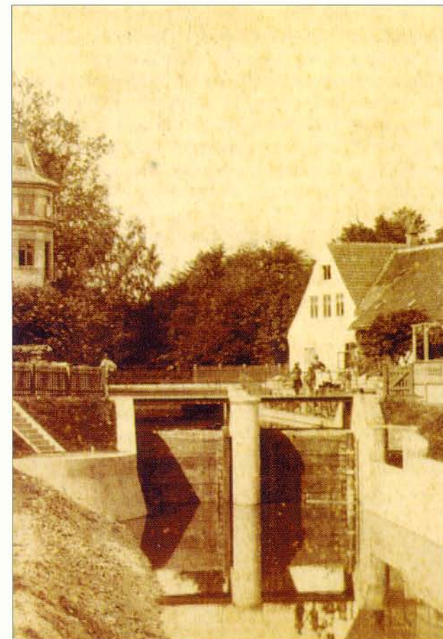
Slusen ved Lyngby Hovedgade 1890