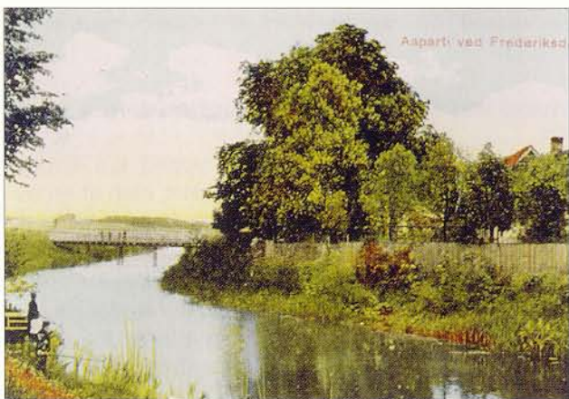
Postkortet fra omkring 1915 forestiller ikke et "Aaparti ved Frederiksdal", som teksten lyder, men Fæstningskanalen med Toftebæksvejs bro i baggrunden. På dette sted fører i dag Kanalstien mellem Lyngby Hovedgade og Lyngby Storcenter.

Fra Lyngby Hovedgade ved Lyngby Kirke fører kanalstien i bunden af den engang vandfyldte Fæstningskanal hen til Toftebæksvej ved hjørnet af Lyngby Storcenter. Herfra fortsatte den langs Lyngby Storcenter, hvor den har givet navn til Kanalvej. Der er stadig en tydelig sænkning i terrænet hen til hjørnet af Klampenborgvej og Kanalvej. Her fra førte kanalen i en lige linie til Ermelundsvej langs den nuværende Ermelundssti og Haveforeningen Ermelunden.