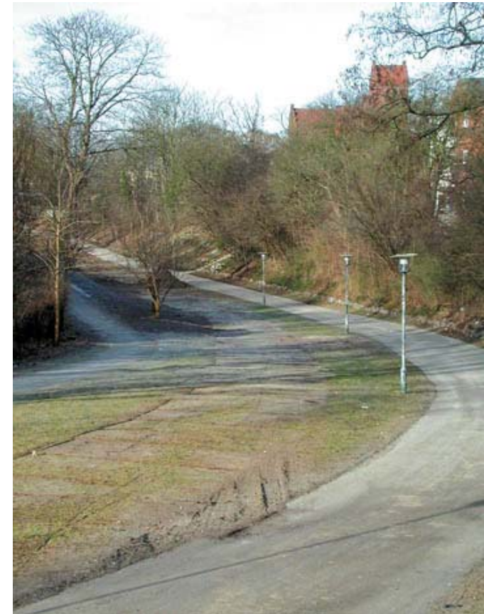
Den "tørre" Fæstningskanal set fra Toftebæksvej mod Lyngby Kirke, der ses i baggrunden