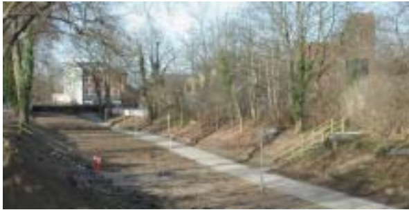
Den "tørre" Fæstningskanal set mod Lyngby Hovedgade